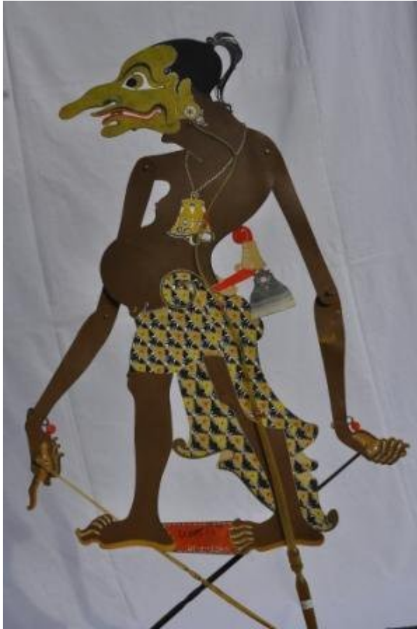
Nama file : WU78 DKW1081 Petruk1 Sosok Penuh.