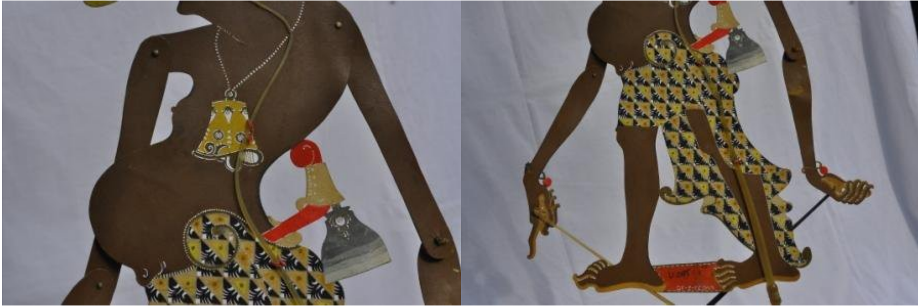
Nama file : WU78 DKW1083 Petruk1 Badan.