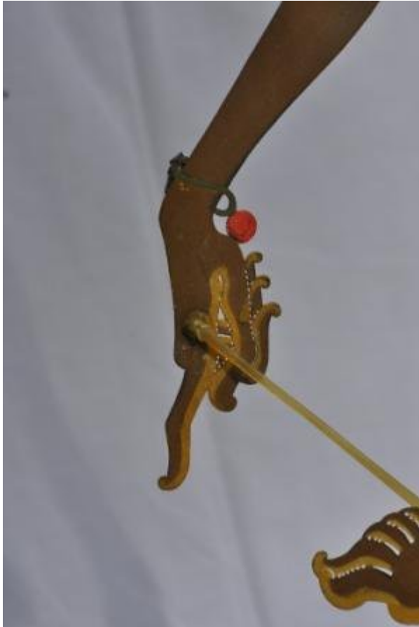
Nama file : WU78 DKW1085 Petruk1 Tangan. Foto : Dewi Kirana Wu, Pekanbaru, Riau.