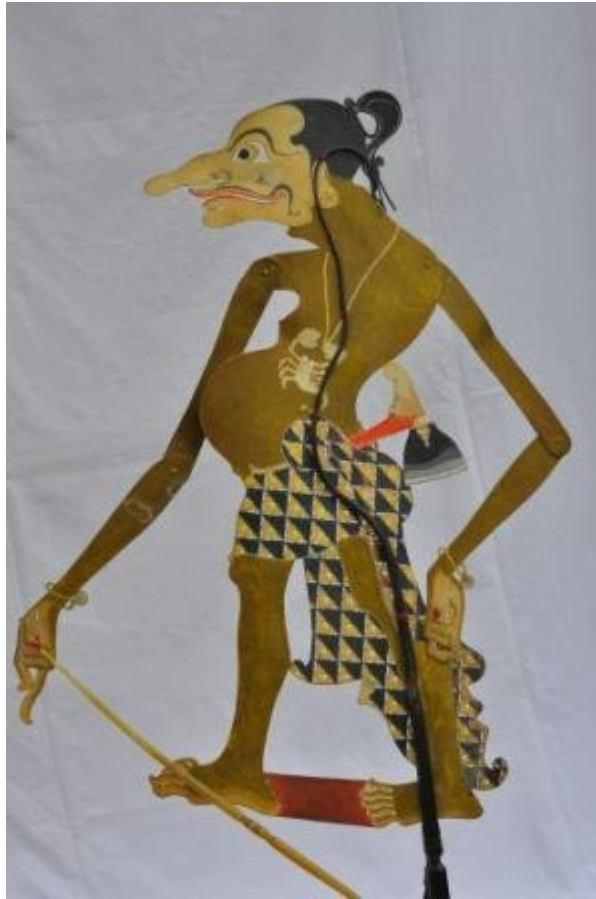
Nama file : WU78 DKW0035 Petruk2 Sosok Penuh. Foto : Dewi Kirana Wu, Pekanbaru, Riau.