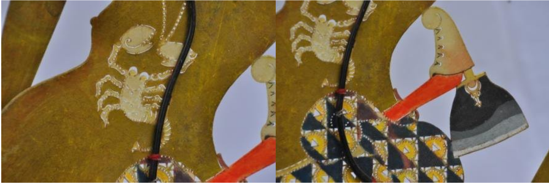
Nama file : WU78 DKW0039 Petruk2 Bandul Kalung. Foto : Dewi Kirana Wu, Pekanbaru, Riau.