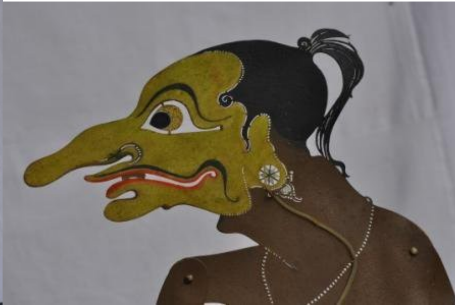
Nama file : WU78 DKW1082 Petruk1 Wajah Foto : Dewi Kirana WU, Pekanbaru, Riau.