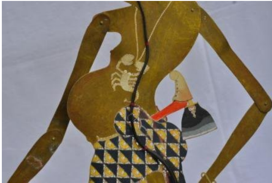
Nama file : WU78 DKW0037 Petruk2 Badan. Foto : Dewi Kirana Wu, Pekanbaru, Riau.