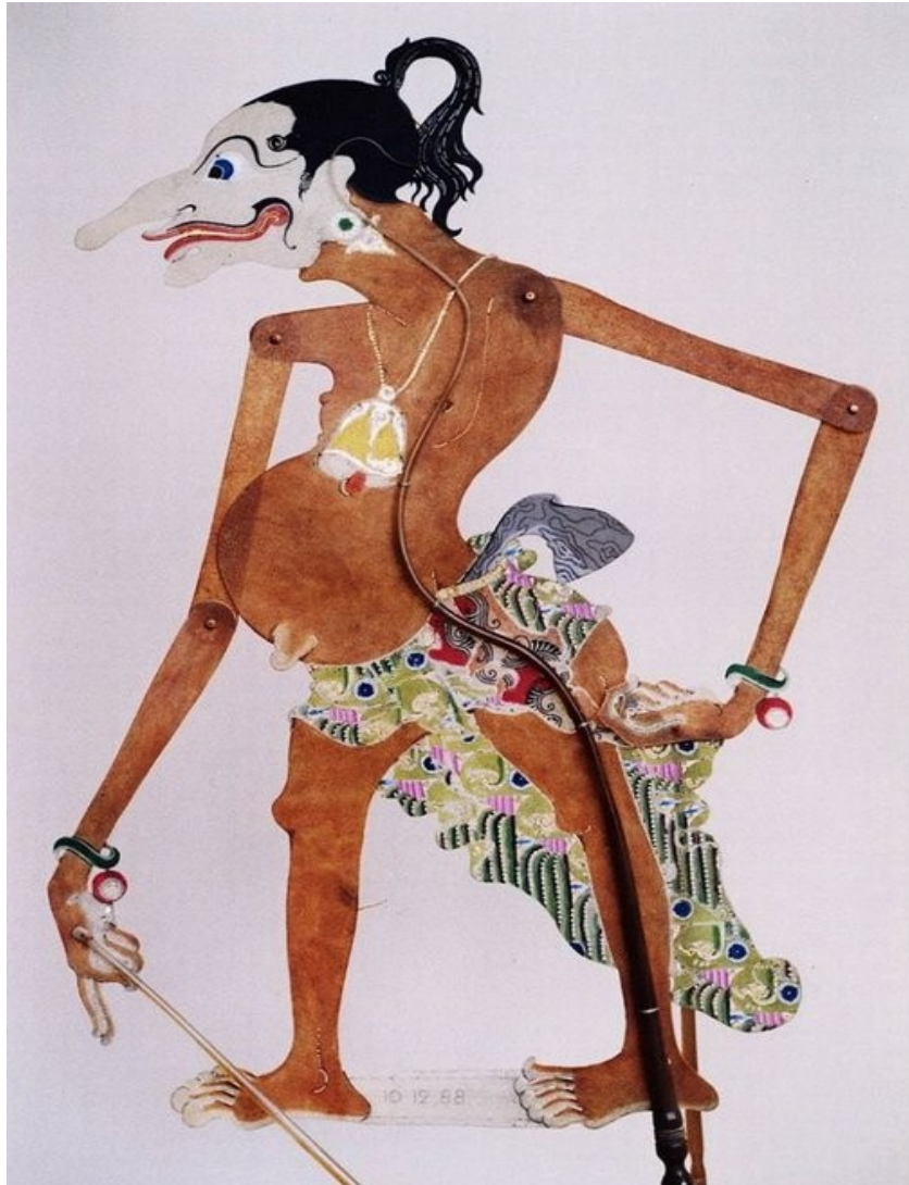
Petruk era 1988.