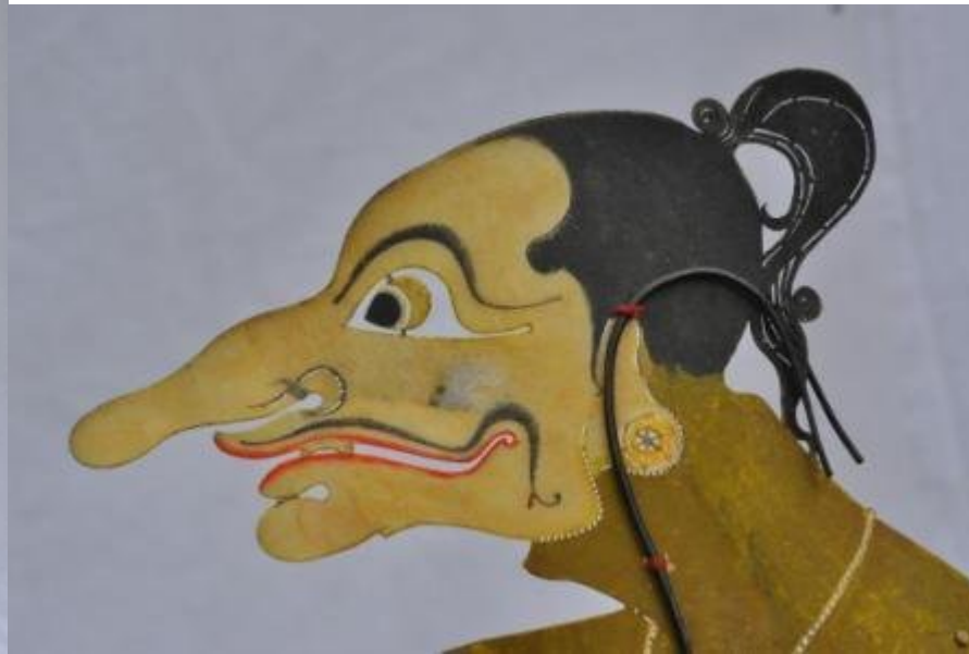
Nama file : WU78 DKW0036 Petruk2 Wajah. Foto : Dewi Kirana Wu, Pekanbaru, Riau.